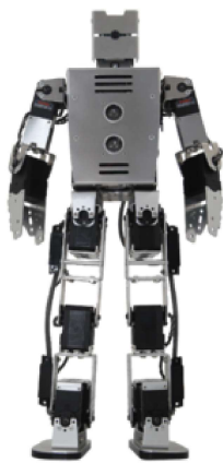
教育用人型ロボット「NDC-HN01」